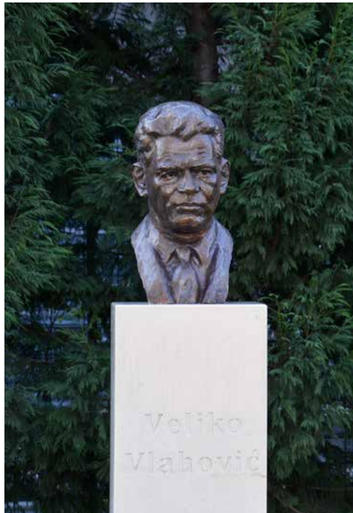
Bista Veljka Vlahovića, postavljena u kampusu Univerziteta Crne Gore 2016. godine